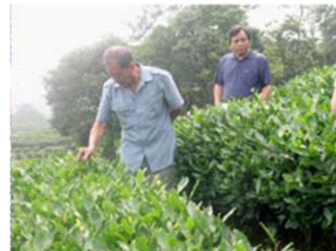
九溪的茶树，明显比前粗壮，健康，有劲