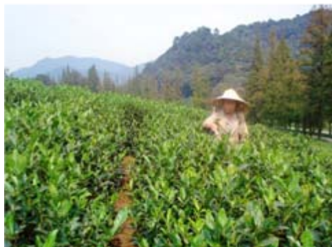
梅家坞龙井茶叶片增厚,而且特别绿